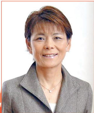
特別講演 宇津木 妙子 氏