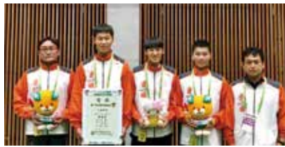
弓道少年男子(遠的1位近的8位)