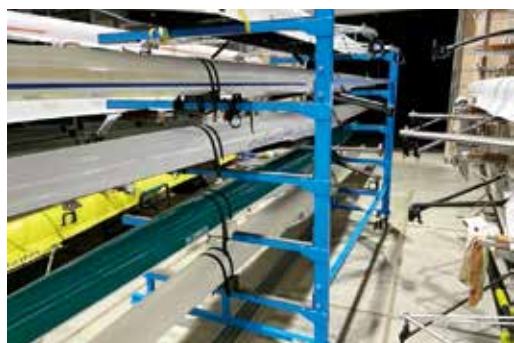
愛媛県ボート協会 備品等整備事業