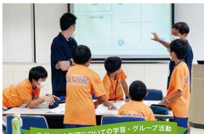
スポーツ少年団についての学習・グループ活動