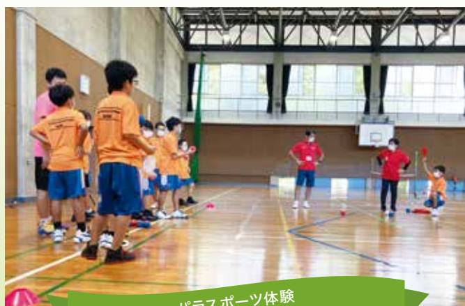
パラスポーツ体験