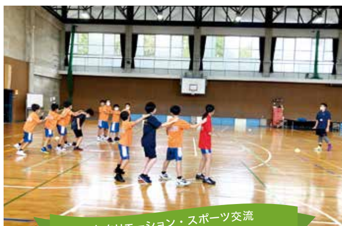
レクリエーション・スポーツ交流