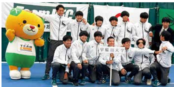
愛媛県テニス協会 大会開催事業