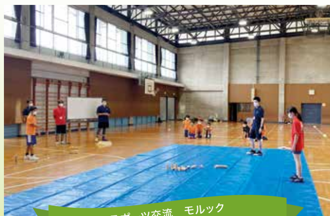
スポーツ交流 モルック